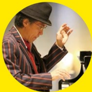
【クニミ上 Kuni Mikami】

渡米約 50 年、New York を拠点に活躍 数々の名門ビッグバンドで演奏する Jazz ピアニスト ライオネル・ハンブトン楽団、デューク・エリントン楽団、 キャブ・キャロウェイ楽団、イリノイ・ジャケー楽団・・・ 「最高のピアニストの一人。彼のピアノにはソウルがある」 (by ライオネル・ハンブトン)